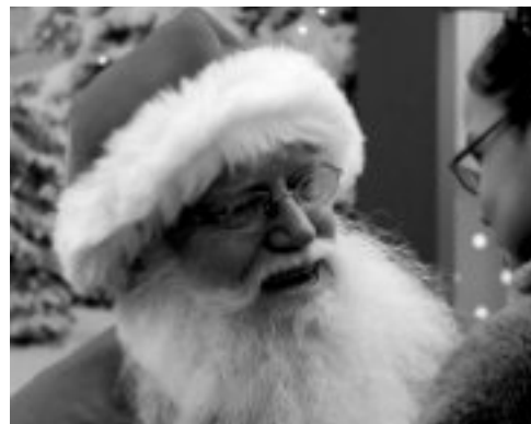
Der Samichlous kommt nach Oberbottigen.

Impressum Pfarramt Oberbottigen der ref. Kircheng- meinde Bümpliz, Bottigenstr. 300, 3019 Bern, 031 926 13 37. Redaktion: Pfr. Stefan Ramseier, Martina Pärli Nr. 39 / Okt 2024; Auflage: 750 Stk.