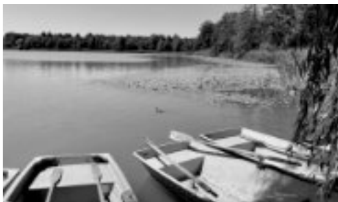
Gemütliche Wanderung um den Burgäschisee.