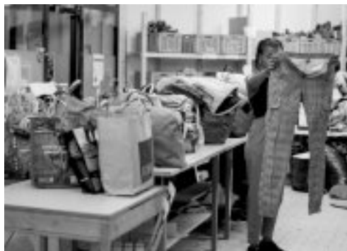
Gesucht werden Kleider, die warmhalten für Menschen auf Fluchtwegen.

In diesem Jahr wollen wir jedoch nicht nur dankbar auf das Jahr zurückschauen